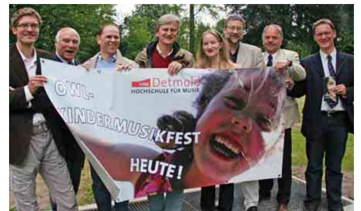
Kindern Musik nahe bringen: Die Macher des OWL-Kindermusikfestes freuen sich auf einen vollen Detmolder Palaisgarten am Sonntag.

Mit Unterstützung unter anderem des Landes NRW, der Peter-Gläsel-Stiftung und des Landschaftsverbandes bieten die Hochschule und die Philharmonische Gesellschaft zahlreiche Workshops, in denen Kinder Instrumente bauen, Body-Perussion erleben oder ein Quiz absolvieren können. Es gibt Klangwald-Installationen, und sie können zusammen mit sechs Schlagzeugern im Palaisgarten trommeln. Aufgeführt wird ein kasachisches Märchen mit Musik und Tanz von Kindern. Zum Abschluss des Festes gibt es mit dem Ensemble Vinorosso und dem Tanzensemble Slawia eine musikalische Zauberreise. Das Catering besorgt die Lebenshilfe.